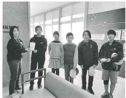
東栄小学校児童会様