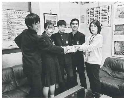
東栄中学校生徒会様

東栄中学校生徒会の皆さん・ 東栄小学校児童会の皆さん から“赤い羽根共同募金”を お寄せいただきました。 ありがとうございました。