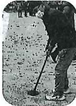
3町村68▶名が参加 勝利目指して頑張ります