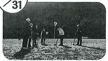
▲48名が参加 草の多いグラウンドに苦戦