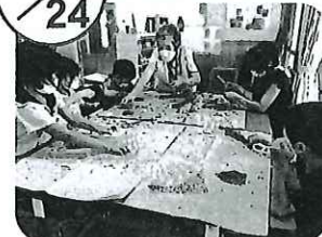
▲ラベンダー匂い袋作り