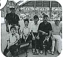
▶ 日頃の練習の成果を発揮