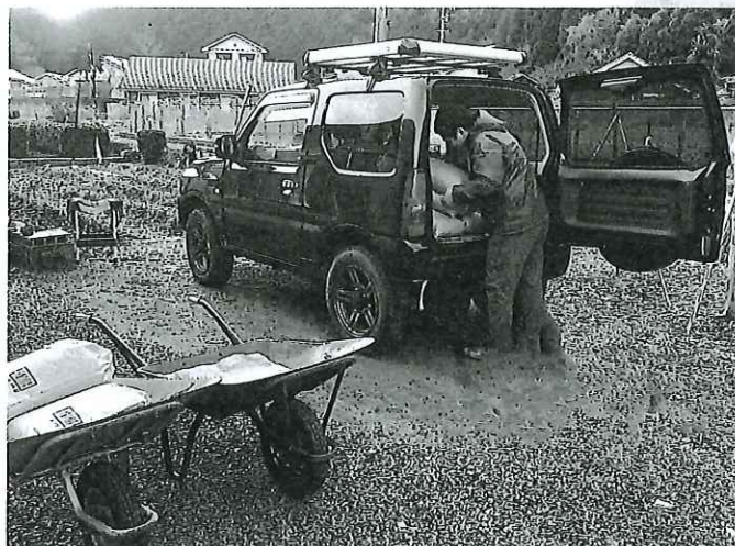
▲農家から購入した玄米を自宅へ運びました