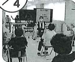
◀ 身体を伸ばして指の体操も