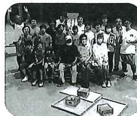
夏休み児童クラブで名人との交流▶