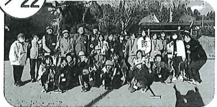
▲東栄町ゲートボール協会さんにゲートボールを教えてくださいました。子どもたちとても楽しんでいました。