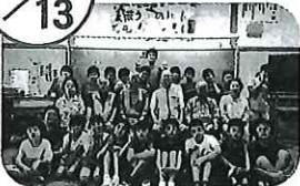
▲明神クラブと東栄小学校4年生 高齢者の生活についてお話を聞きました