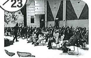
▲転ばぬ先の健康づくり