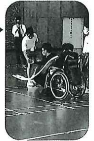
すぎのきの里と中学1年生の交流▶