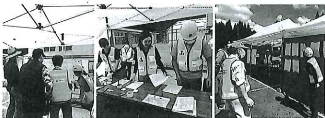
▲災害ボランティアセンター設置運営訓練