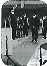
4年ぶり▶の開催 40名の会員が参加