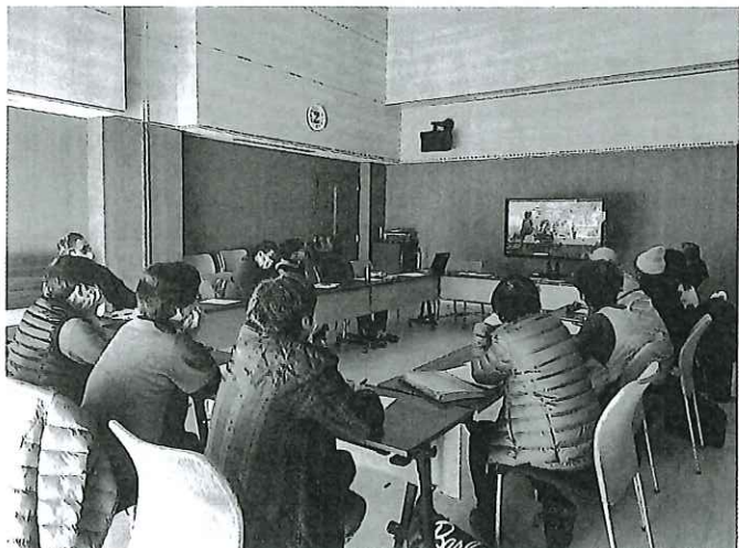
▲あんきにサポート研修

地域の方たちに少しずつ知ってもらい利用も増えつつあります。サポーターのフォローアップ研修の場では、この活動の課題や地域の課題について考えました。地域のみなさんが利用しやすいしくみづくりに取り組んでいます。活動を通じて地域の繋がりを深めていきましょう。