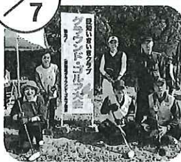
◀ グラウンドゴルフに園チームが参加